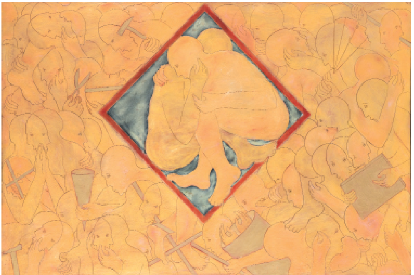
Sans titre 2013 Cire et pigments sur bois h : 300 x 200 cm