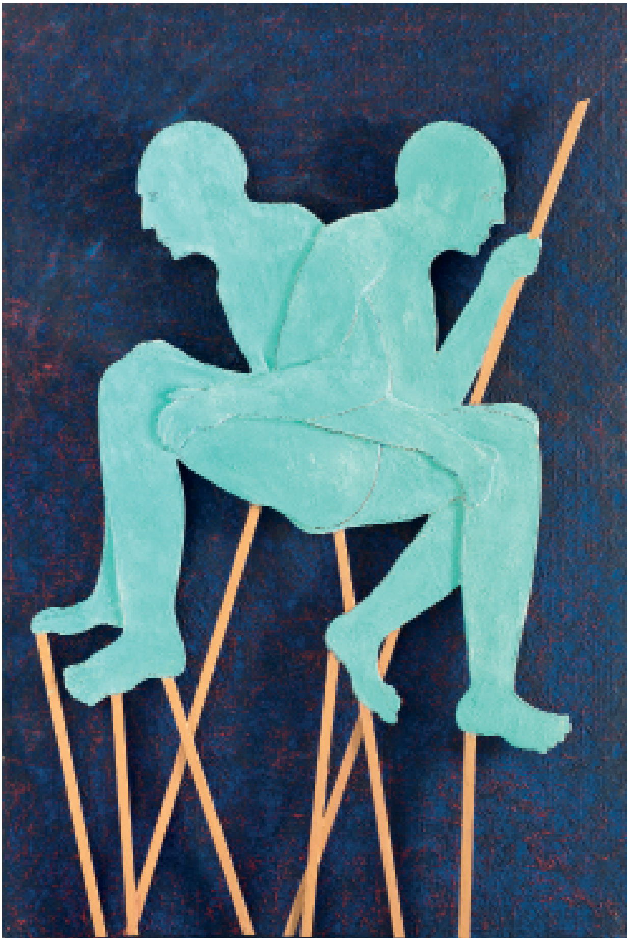
Sans titre 2016 Cire et pigments sur bois h : 226 x 155 cm