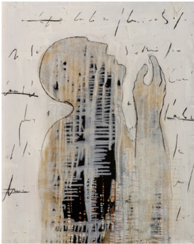
Sans titre 2017 Goudron et huile sur papier h : 80 x 100 cm