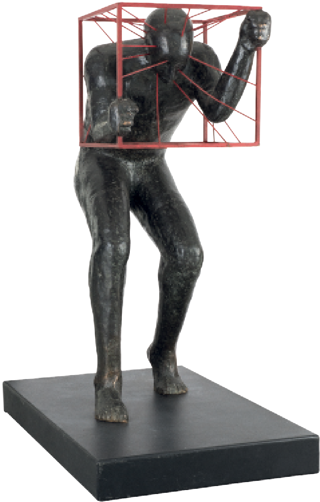
Sans titre 2016 Sculpture en bronze h : 160 cm